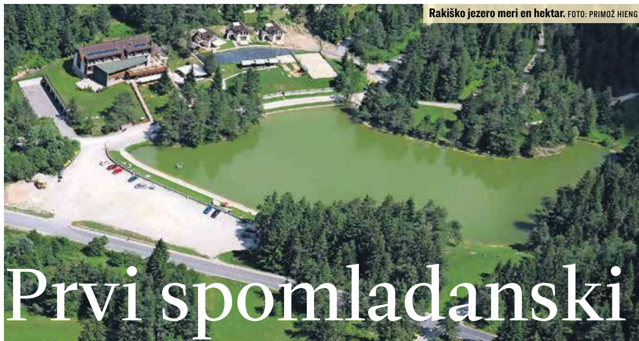
Rakiško jezero meri en hektar.

To nedeljo se lahko bosu sprehodite med briškimi vinogradi in češnjami. Ob 11. uri se boste izpred dvorane na Humu, ob spremstvu energijske kinezioterapevke, turističnega vodnika, radiestezista in raziskovalca vpliva srca na človeka, odpravili na dvourni izlet po pobočju Korade. Po vrnitvi še zvočna kopel in malica. Informacije: 05 395 95 95, www.brda.si .